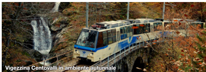
Vigezzina Centovalli in ambiente autunnale