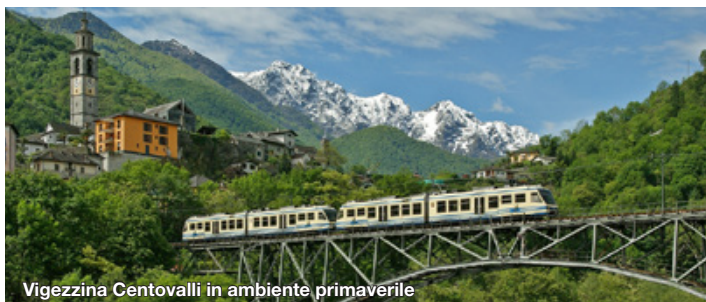
Vigezzina Centovalli in ambiente primaverile