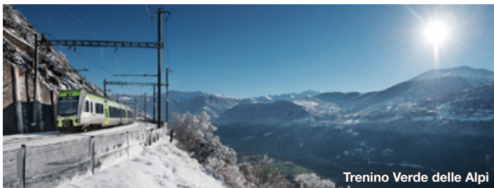
Trenino Verde delle Alpi

Tutti coloro che non sono Soci del Cai e che volessero partecipare alle escursioni dovranno stipulare una assicurazione temporanea contattando la sezione entro due giorni lavorativi dalla data di effettuazione della gita.