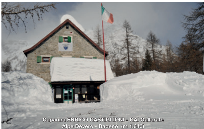
Capanna ENRICO CASTIGLIONI - CAI Gallarate Alpe Devero - Baceno (m 1.640)