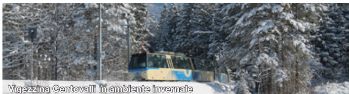
Vigezzina Centovalli in ambiente invernale

Info: CAI Sezione di Novara, Vicolo S. Spirito, 4 - 28100 Novara tel. +39 0321.625775 - email: novara@cai.it - alpinismo.giovanile.novara@gmail.com www.cainovara.it - Pagina Facebook: CAI Alpinismo Giovanile Novara ASAG Elisa Varalli - 348.2433848 - elisavaralli@gmail.com ASAG Giorgio Gallese - 347.8684069 - gallesegiorgio@gmail.com