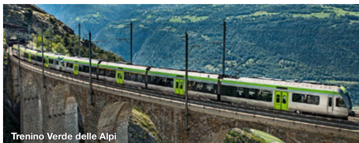
Trenino Verde delle Alpi

www.sandomenicoski.com www.alpeveglia.it