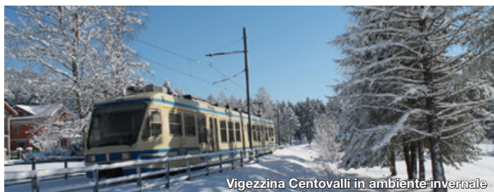
Vigezzina Centovalli in ambiente invernale