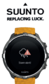
Spartan Sport Wrist HR Baro

VILLADOSSOLA - Piazza Bagnolini, 12 - Tel. 0324.53633 info@gianolagioielleria.it - www.gianolagioielleria.it