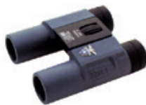
Binocolo Ziel CAI Edition

Approvato dal CAI Rivenditore autorizzato